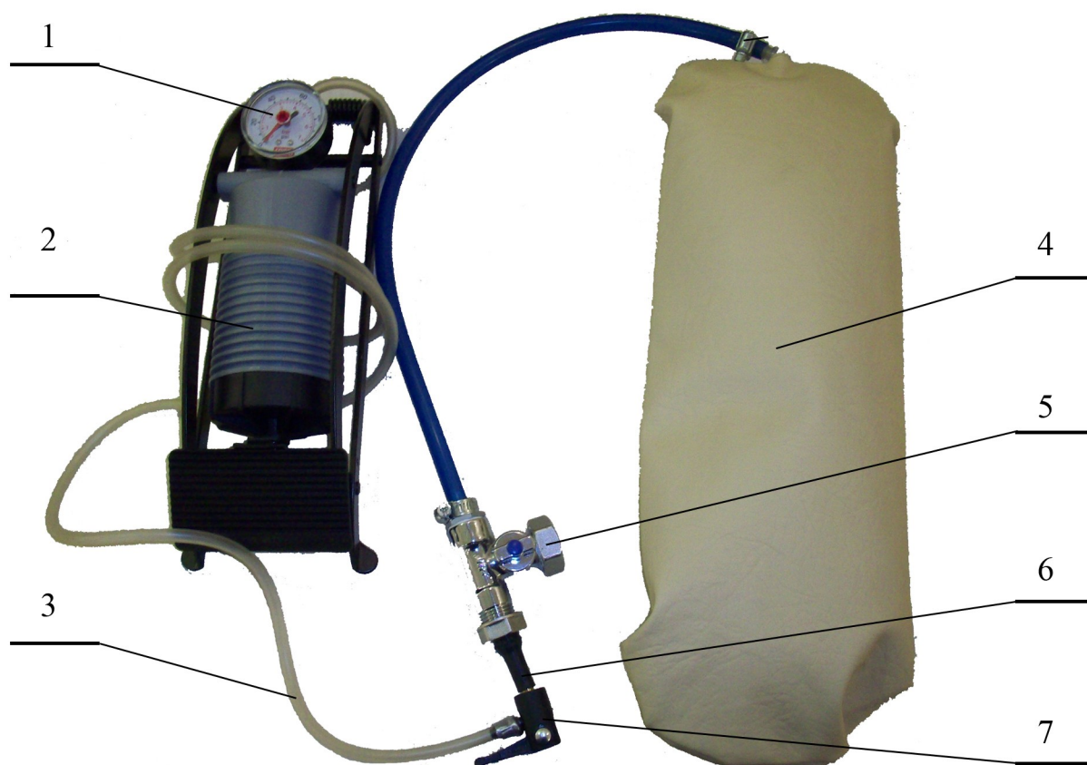
Рис.2 Валик надувной (поставляется по заказу) - для подъема участка тела