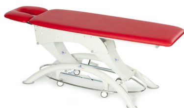
Lojer 105E-2 секции, цвет-Chill, ножки из трубы круглого сечения, педаль регулировки высоты в виде рамы, набор колес