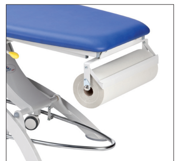
Держатель одноразовых простыней