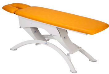
Lojer 105E-2 секции, цвет Mango, ножки из трубы прямоугольного сечения

Значения символов • = Стандартная характеристика - = Не доступно