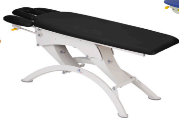
Lojer 105E-4 секции, цвет - Schwarz, ножки из трубы прямоугольного сечения