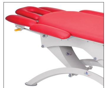
Боковые опоры с механизмом быстрой фиксации