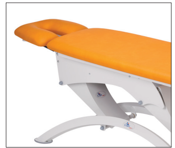
Lojer 105E-2 секции, опорные ножки из трубы прямоугольного сечения