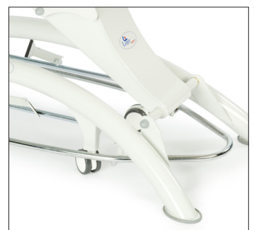
Центрально-блокирующиеся колеса и педаль регулировки высоты в виде рамы