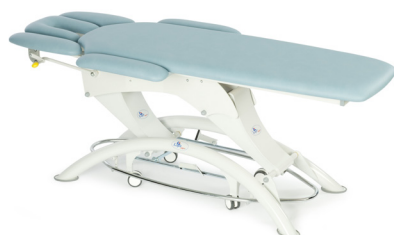
Lojer 105E-4 секции, цвет-River, ножки из трубы круглого сечения, педаль регулировки высоты в виде рамы, набор колес, боковые опоры