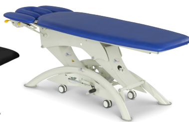
Lojer 105E-4 секции, цвет-Оcean, гидропривод высоты ножки из трубы круглого сечения