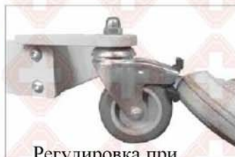
Регулировка при помощи ног