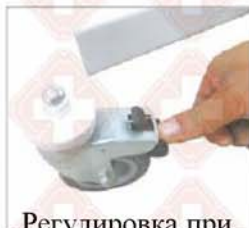
Регулировка при помощи рук